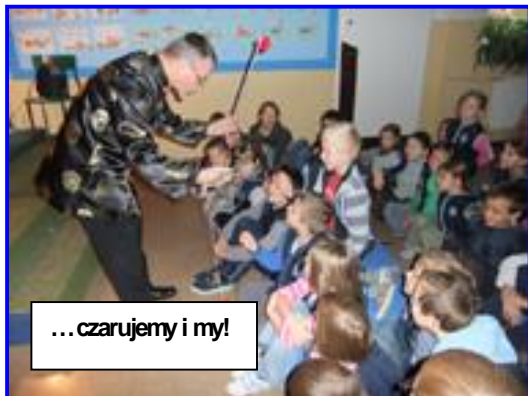
...czarujemy i my!